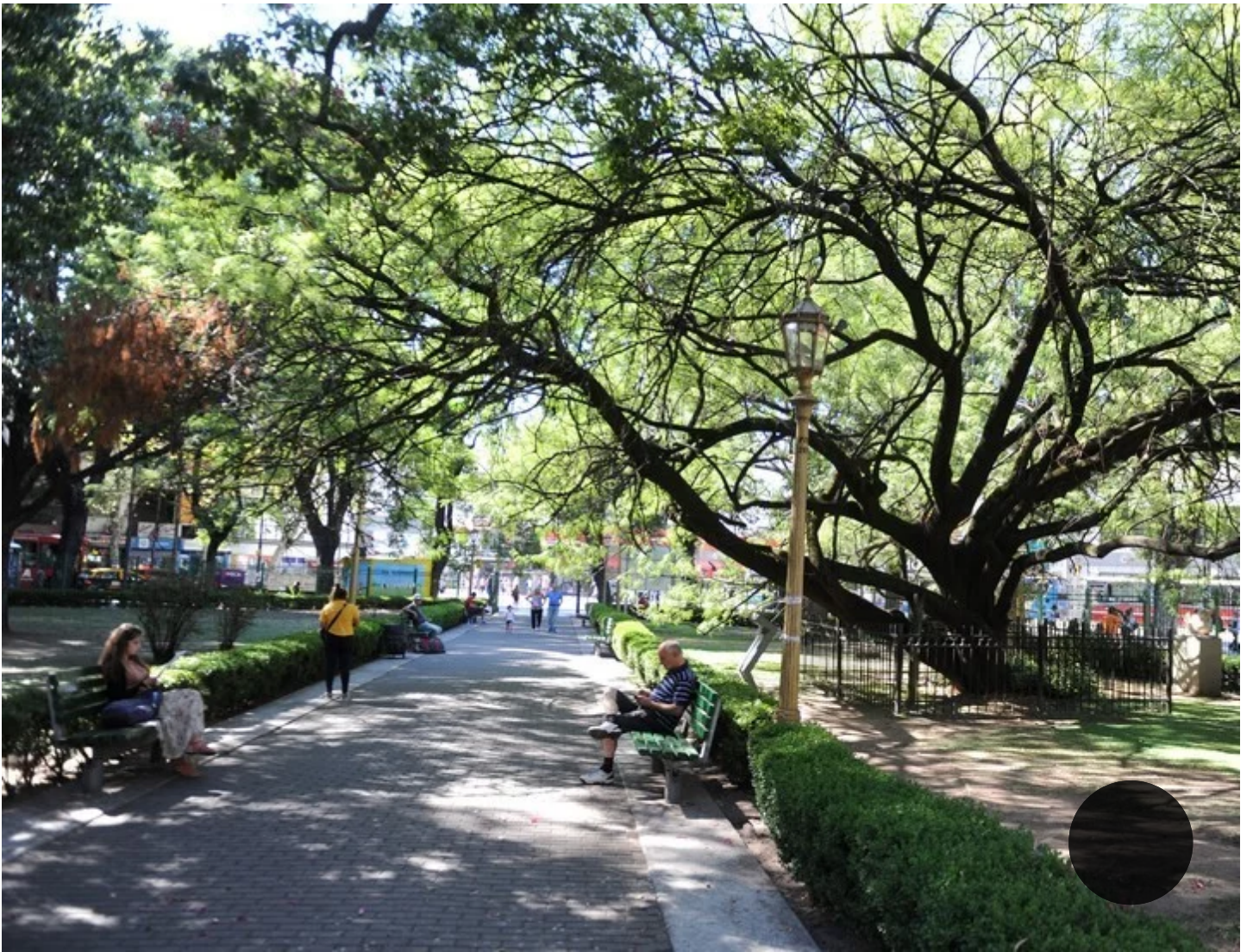
Algarrobo de Pueyrredón. En Plaza Flores, es un retoño del árbol bajo el que, se cuenta, San Martín y Pueyrredón hablaron sobre las luchas libertadoras en San Isidro.