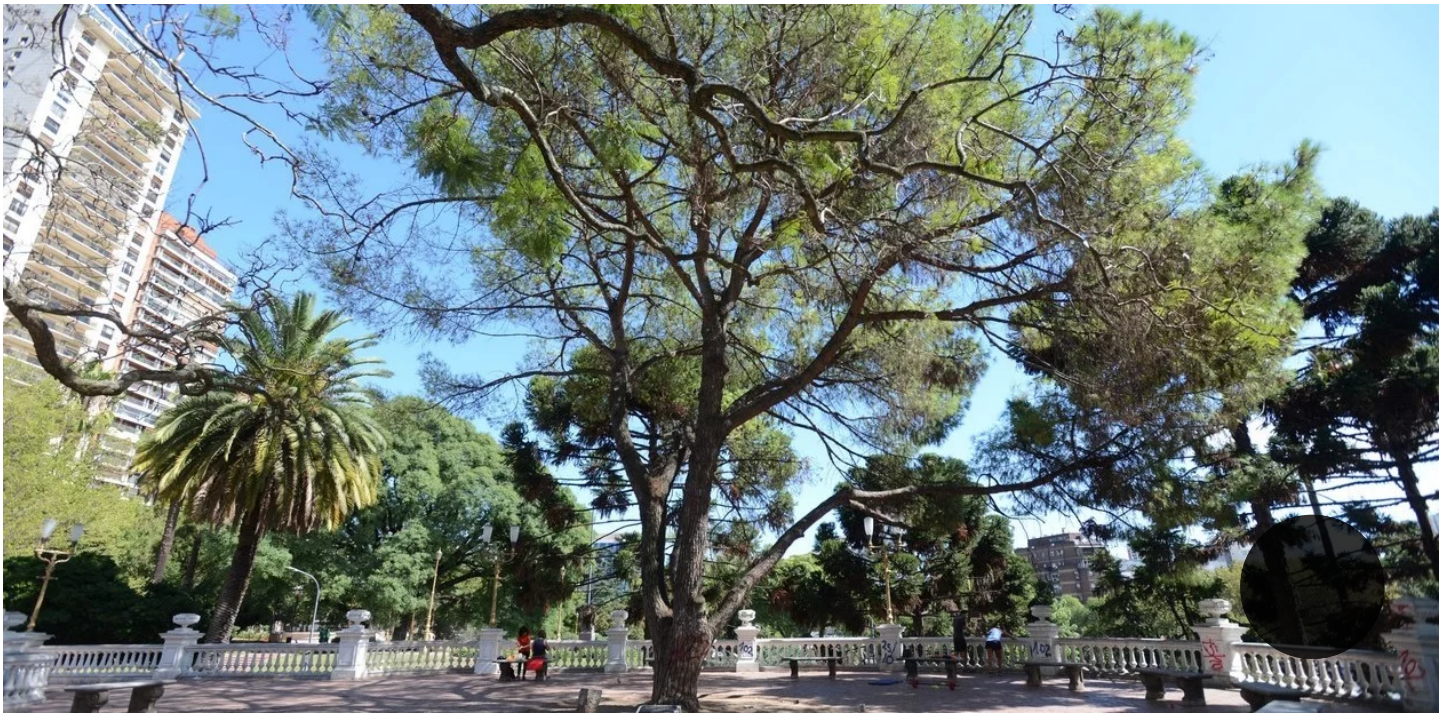
Pino de San Lorenzo. Recuerda la batalla de San Lorenzo, en la cima de Barrancas de Belgrano.

Recuerdan desde una “pelea” entre Sarmiento y Avellaneda para decidir si plantar una magnolia o un arrayán hasta la Escuela de Medicina pionera en Buenos Aires. Mirá.