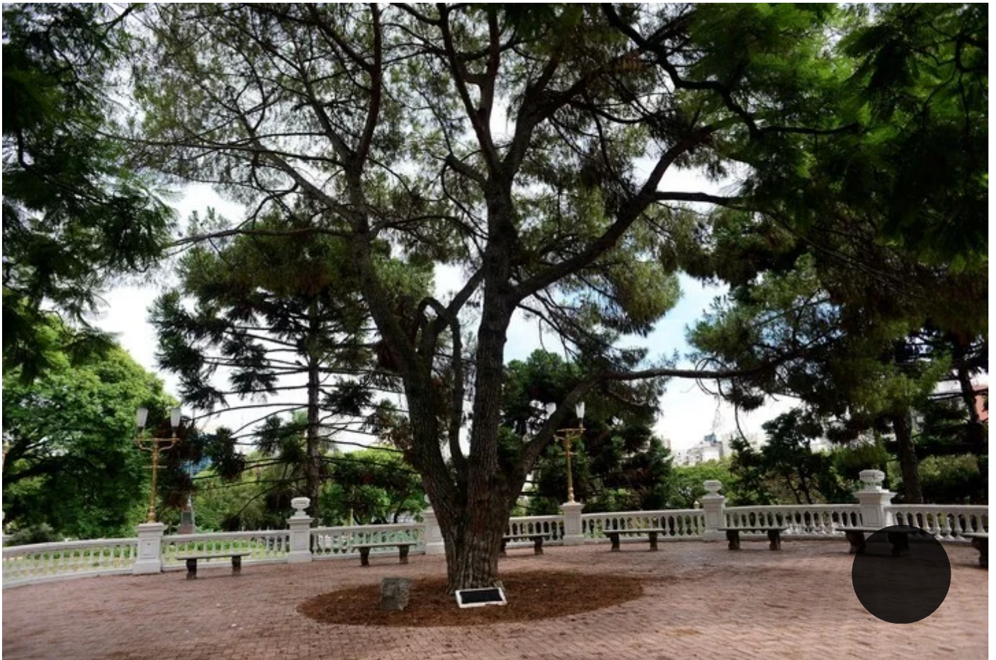
Barrancas de Belgrano. El pino de San Lorenzo, plantado en la década de 1930.

Cuando Sarmiento era aún presidente, apareció la idea de crear un Parque en los ex terrenos de Rosas y él quería plantar un arrayán. La obra del Parque se atrasó y la apertura pasó a Avellaneda, su sucesor, quien pensaba que la magnolia representaba rasgos americanos, además de haber sido elegida por su mujer Carmen. “Con su blanca flor salvaje que pueblos numerosos de América enredaban en el suelto cabello de sus jóvenes mujeres como símbolo de pureza...”, escribió. “La magnolia desaparecerá en poco tiempo -decía Sarmiento-. Necesitamos un árbol perdurable”. Y sembró el arrayán, que se secó hace unos años.