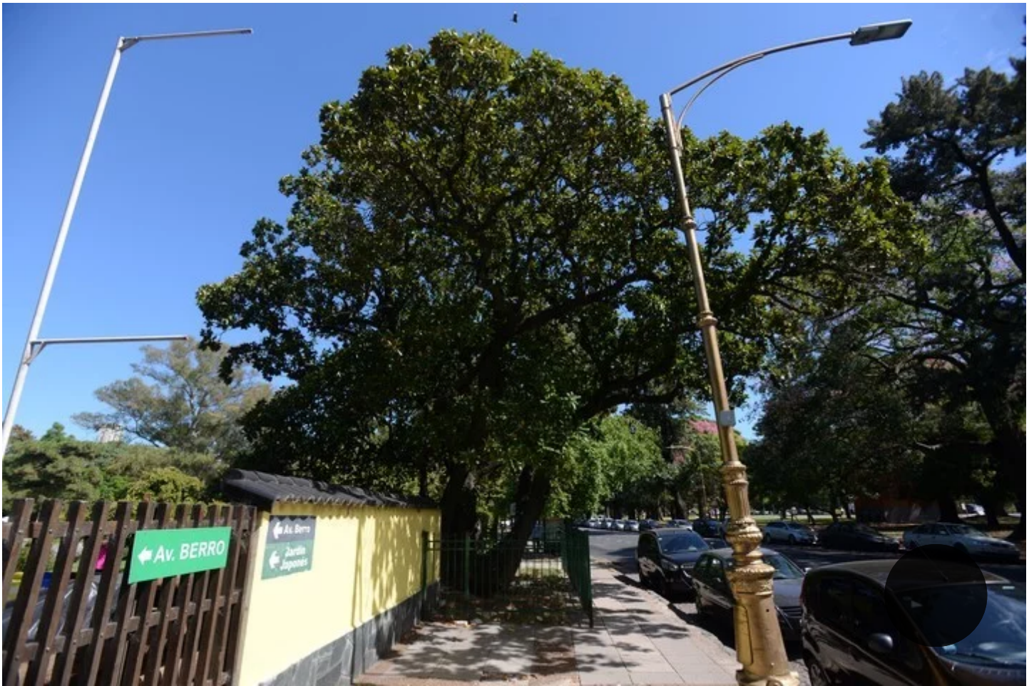
Nube verde. La magnolia de Avellaneda, en Berro, a metros del ingreso al Jardín Japonés. / Luciano Thieberger

4) Magnolias del Protomedicato. Son dos. Y son lo único original que queda aquí del siglo XVIII, cuando vivían miembros de la orden religiosa de los betlemitas. Desde Turismo de la Ciudad, indican que en el Virreinato funcionó en este espacio el Protomedicato -que regulaba la medicina- y entre 1858-1887, la escuela pionera de esa disciplina en Buenos Aires. Hoy se conservan en uno de los patios de la Escuela Rawson, ubicada en Humberto Primo 343, al lado de la Iglesia San Pedro Telmo.